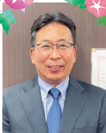
令和5年 盛夏 株式会社 ベストインシュアランス